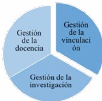
Figura 1. Funciones Sustantivas