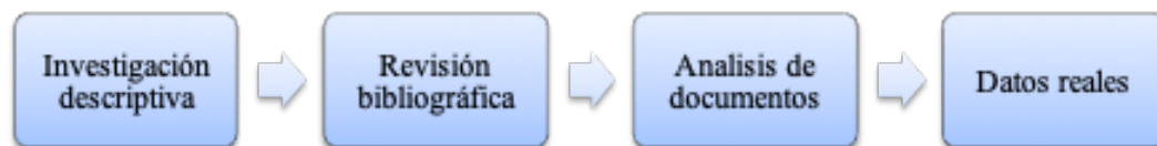
Figura 1. Métodos de investigación

En este sentido, se puede entender que esta misión no está alejada de una de las necesidades de los seres humanos, pues generar medios de vida sostenibles servirá para la reducción de la pobreza y su propio desarrollo.