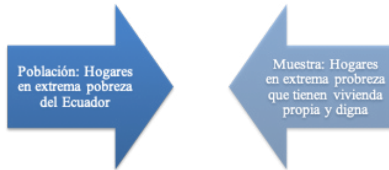
Figura 2. Población y muestra