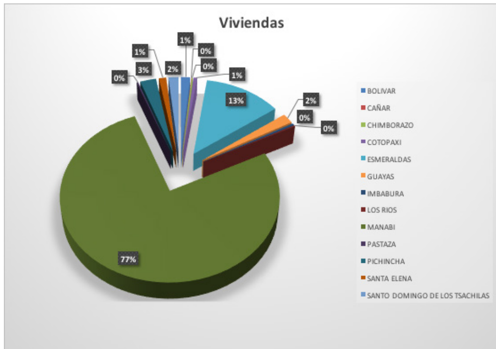
Figura 4. Casas entregadas - programa "Casa Para Todos" por provincias