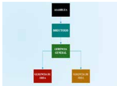
Figura 1. Estructura del Gobierno Corporativo